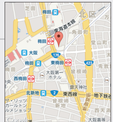
梅田阪急ビル オフィスタワー 阪急各線・阪神本線・地下鉄 御堂筋線「梅田駅」徒歩3分 / JR大阪環状線「大阪駅」徒歩4分